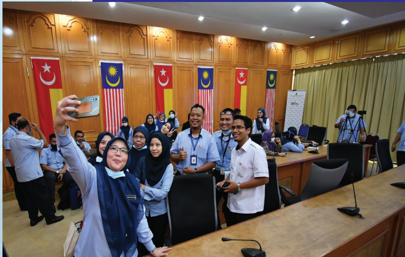
TEMPAT : PEJABAT SUK SELANGOR | 12 - 13 OKTOBER 2020

Komitmen sokongan daripada semua warga kerja Pejabat SUK Selangor merupakan di antara kunci terbaik selain mendapat sokongan daripada pihak pengurusan bagi menjayakan pelaksanaan EKSA ini. Pensijilan ini merupakan kali kedua berjaya dipersijilkan selepas jabatan ini telah dipersijilkan Cemerlang pada tahun 2018 yang lalu.