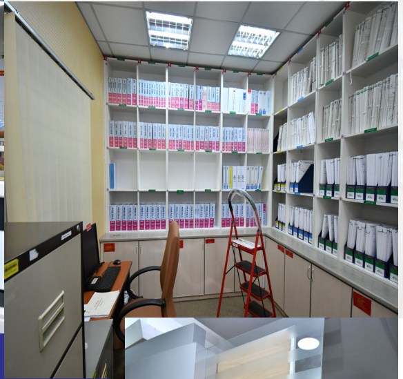
TEMPAT : PEJABAT SUK SELANGOR | 12 - 13 OKTOBER 2020